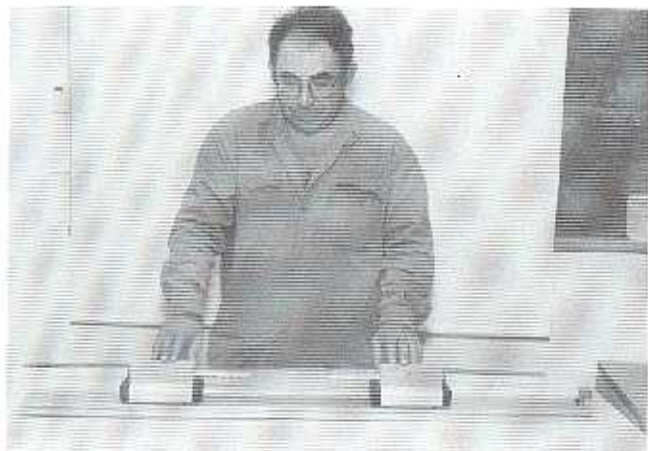
א. לפני התבוננות.