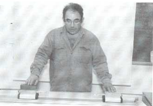
א. לפני ההתנסות.