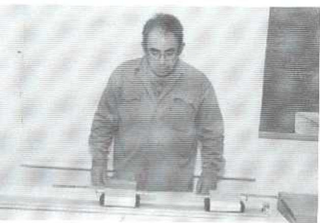
ב. אחרי ההתנסות.

תרשים 6: התנועות בין קרובות שומת מסה. תנועת א' לקראת א' במהירות שוות גודל.