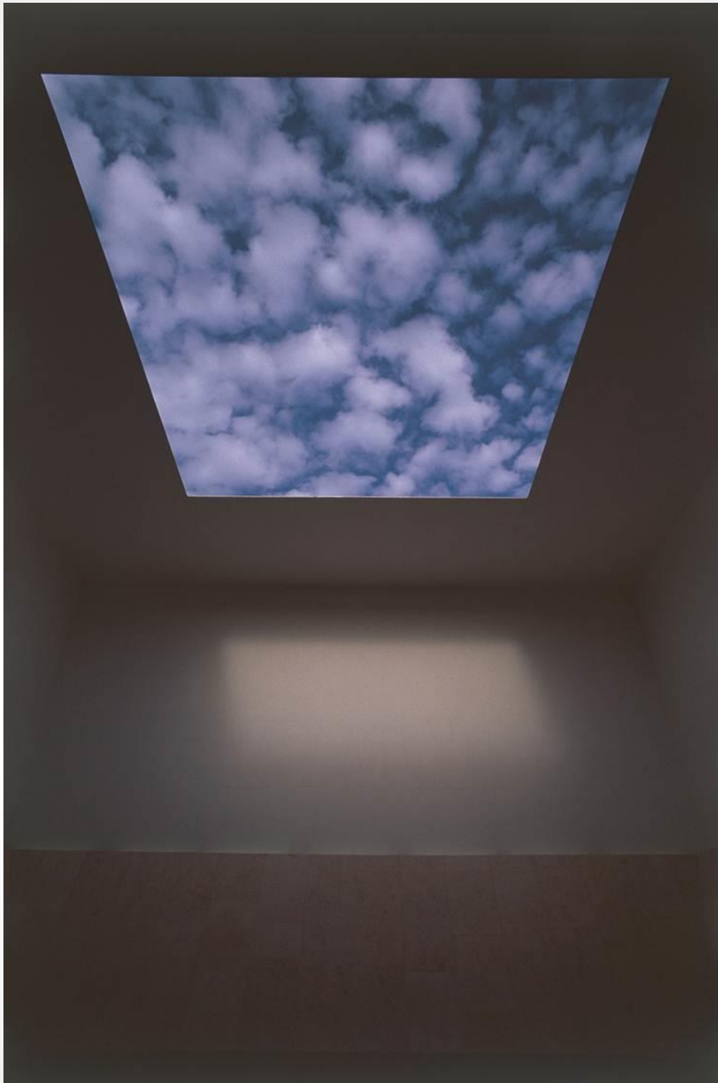
James Turrell, Space That Sees, 1992 מוזיאון ישראל, גן הפסלים